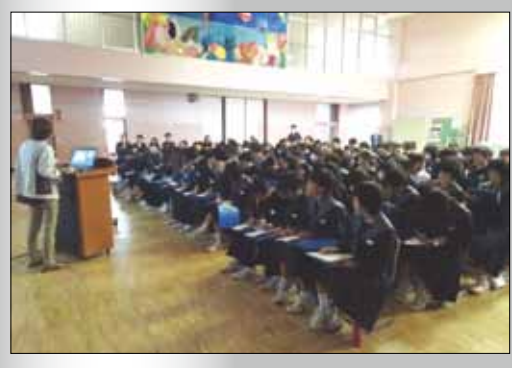
真剣な眼差しで話に聞き入る生徒の皆さん

また、庄西中学校では、地域福祉活動とボランティアについて、市社協職員から話を聞きました。生徒は熱心に話を聞き、「ボランティアは増えていますか？」などの質問もあり、関心の高さが窺われました。